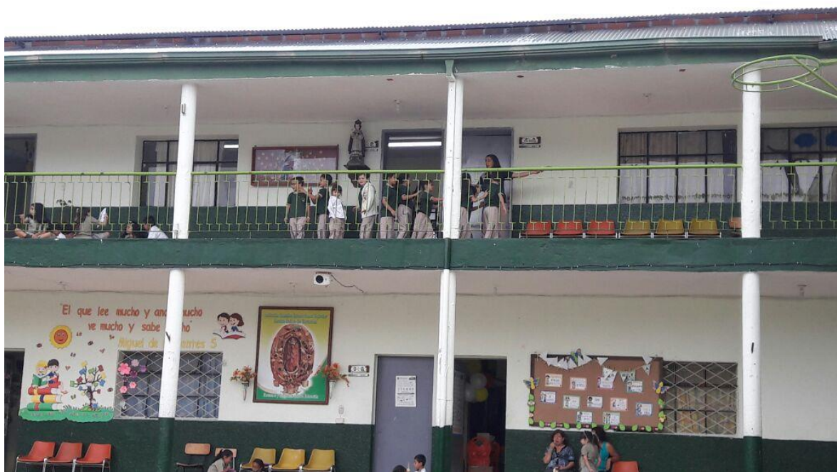
Algunos juegos de la dinamica “ interaccion social”.