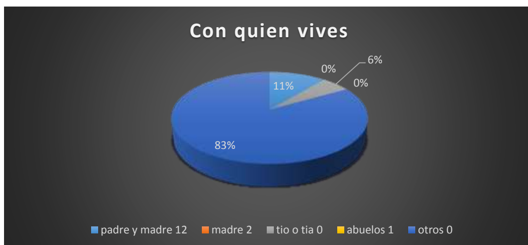
Gráfico 1 ¿Con quién vives?