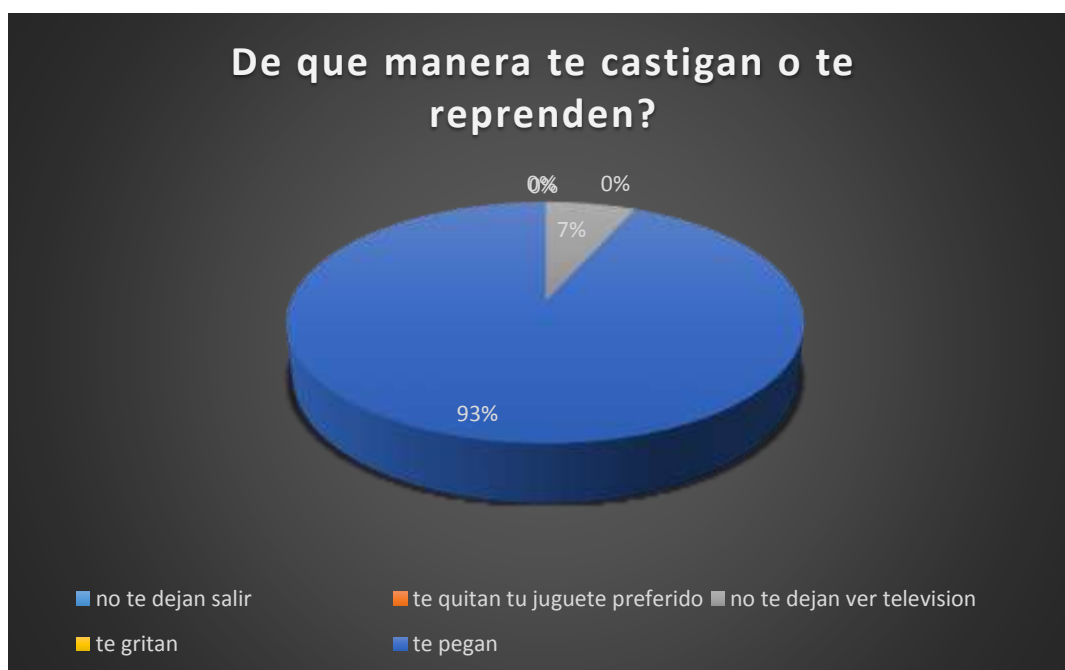
Gráfico 4 De que manera te castigan o te reprenden