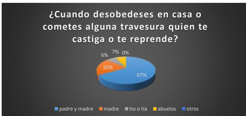
Gráfico 3 ¿Cuando desobedeces en casa o cometes alguna travesura quien te castiga o te reprende?