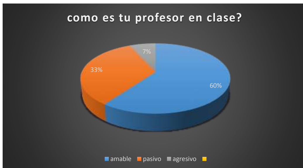
Gráfico 10 Como es tu profesor en clase?