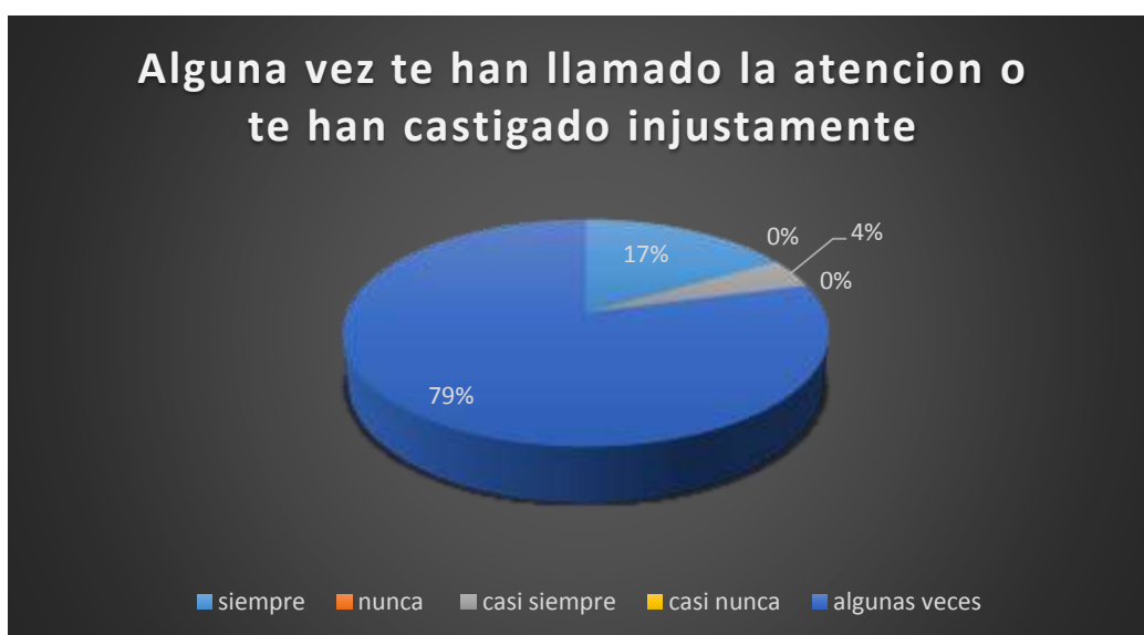
Gráfico 6 Alguna vez te han llamado la atención o te castigado injustamente?