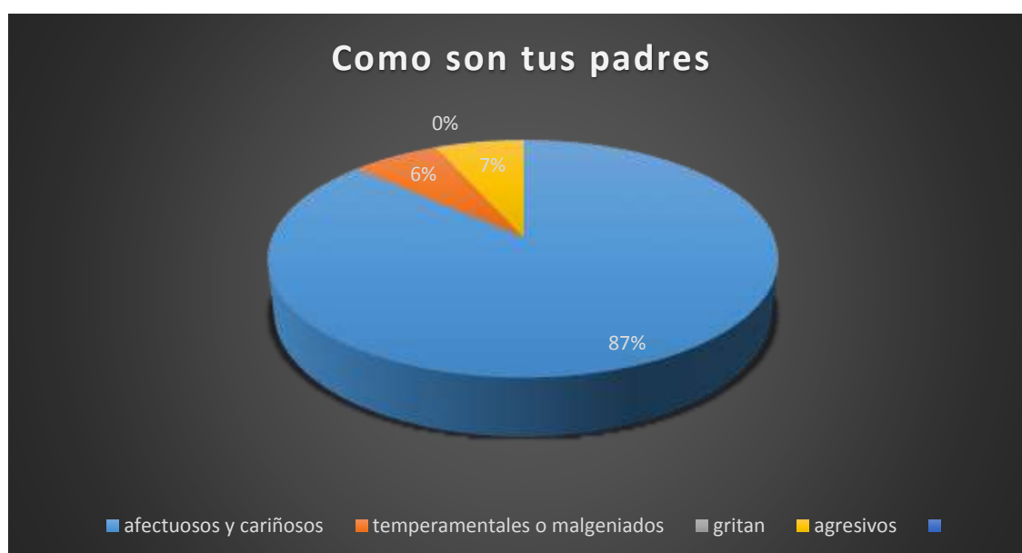
Gráfico 2 Como son tus padres?