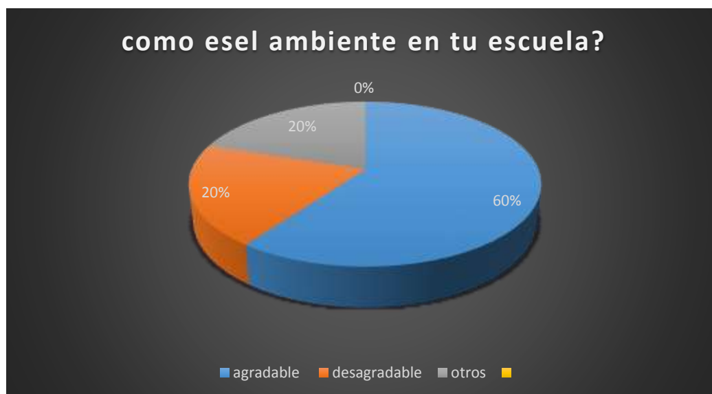
Gráfico 9 Como es el ambiente en tu escuela?