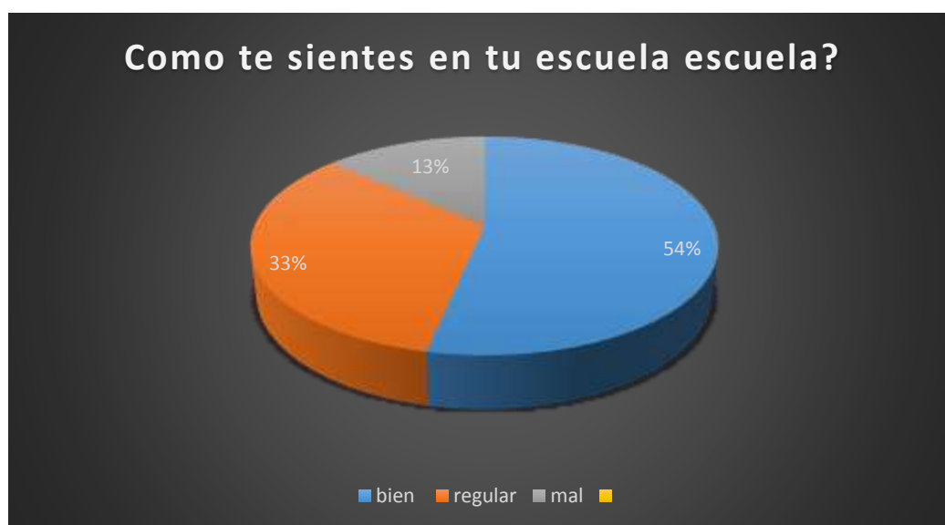
Gráfico 8 Como te sientes en tu escuela?